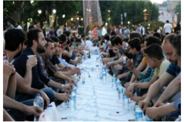
Medine'de kurulan bu iftar sofrası ile Ayasofya meydanında kurulan iftar

sofrasının verdiği mana aynıdır. Aynı İslam kardeşiliğine, huzuruna ve birliğine işaret eder. Kardeşlik için fedakarlığı, diğerkamılığı, sevgiyi ve sabrı anlatır. Aynı Allah'ın kulları olarak teslimiyeti, var olana şükrü ve olması istenene acziyetle duayı söyletir. Sessizce iftarı beklerken dizginlenen nefislerin üzerinde, yiğit misali heybetle yükselen imanlarının güç ve güzelliklerini gösterir. Sınırsız açık büfelerde doymayan gözlere inat, bir bardak su ve bir kaç hurmaya kanaat ederek coşan zenginliği tattırır.