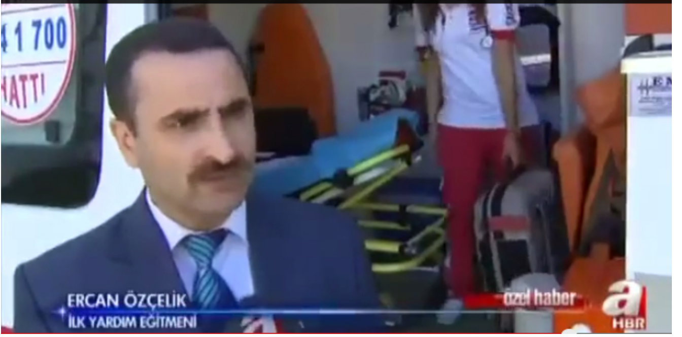
A Haber’de yayınlanan ve trafikte ambulanslara yol verilmesini konu edinen “Hayat Kurtarma Yarışı” başlıklı özel haber.