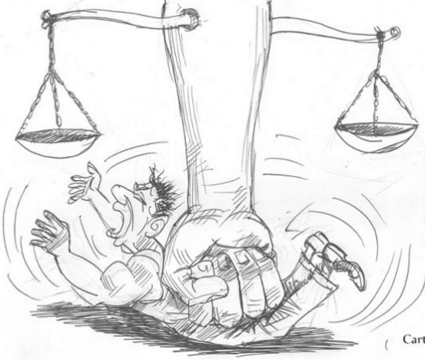
Cartoon: Elias Areda/ thereporter

Günümüz Türkiye'sinde geleneksel aile yapımıza sistemli ve resmileştirilmiş saldırıların zirve yaptığı, tipik bir ahir zaman dönemini dehşetle yaşamak zorunda kalıyoruz! Üstelik aile kurumuna, yani neslimize yapılan tahribatların, geri alınması imkansız derecesinde zor ve uzak olduğu da koca bir gerçek olarak karşımızda duruyor.