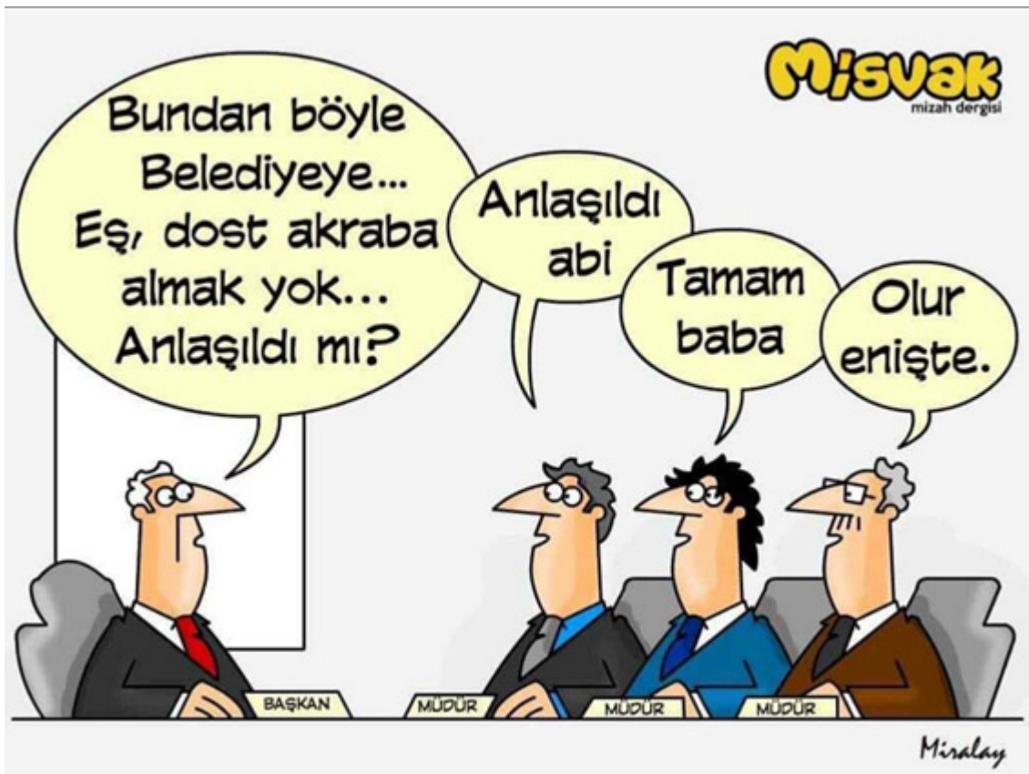
Şekil 1. Belediyelerde Nepotizm Karikatürü

Kamuda nepotizmin en yoğun yaşandığı yerlerden birisi de yerel yönetimlerdir. Yerel yönetimlerde seçimle işbaşına gelen kişilerin belediye bünyesinde veya iştiraklerinde aile ve akrabalarını yerleştirmeleri neredeyse sıradan olaylar arasında sayılmaktadır. Akrabalık ilişkileri nedeniyle, aynı soyadı taşıyan bazı kişilerin yerel yönetimlerde istihdam edildiğine dair haberler medyada sık sık yer almaktadır (Birgün, 2019).